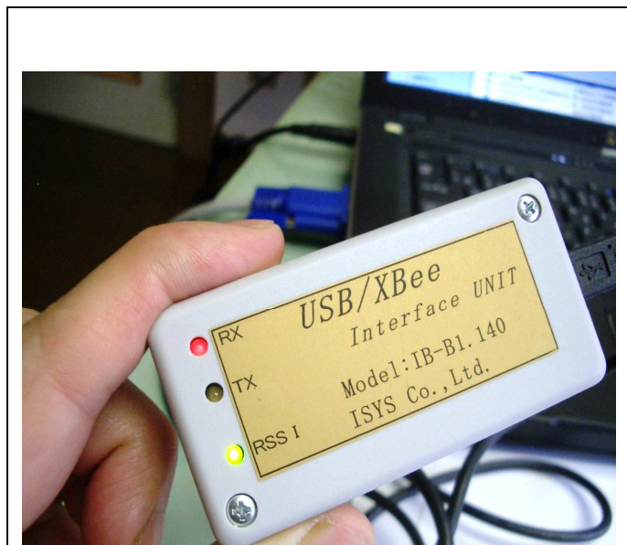
株式会社 アイシス (iga-ueno)